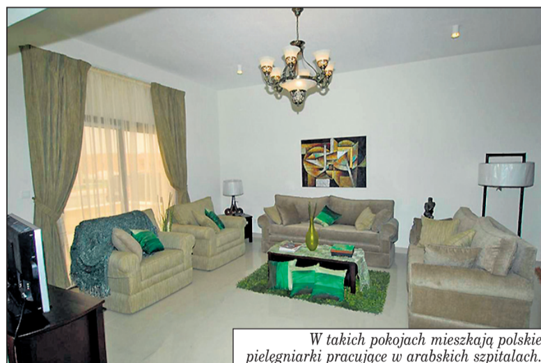
W takich pokojach mieszkają polskie pielęgniarki pracujące w arabskich szpitalach.

oferują dwa miesiące płatnego urlopu. Wszyscy pracownicy mają doskonale wyposażone, całkowicie darmowe mieszkania, a jeżeli już zachorujemy to przez pierwsze 30 dni chorobowego otrzymamy 100 proc. uposażenia. Kolejne tygodnie to 80 proc.