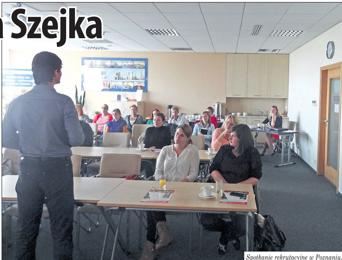
Spotkanie rekrutacyjne w Poznaniu.

Około 100 zł zapłacimy za przekład dokumentów tłumaczom przysięgłym. 550 zł kosztować nas będzie wiza. Firma G5 PLUS oferuje pełną pomoc podczas procedury jej załatwiania. Czeka nas